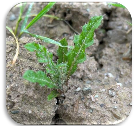
Chardon des champs Bouchemaine (49) 1 er mars 2024

34 dicots (et vivaces) différentes versus 23 il y a deux semaines