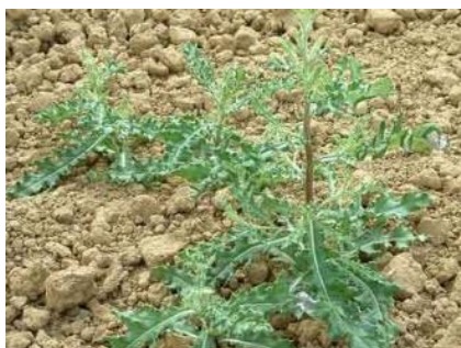
CHARDON DES CHAMPS