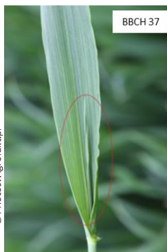
La dernière feuille est juste visible, elle est encore enroulée sur elle-même

BBCH 39: Le limbe de la dernière feuille est entièrement étalé, la ligule est visible